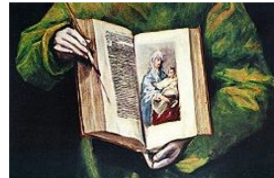
Detalle de San Lucas Evangelista , por Doménikos Theotokópoulos (El Greco)

Biblioteca General Edificio Madre de Dios