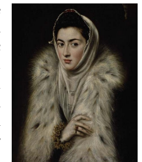
"La dama del armiño"

En su periodo de madurez, El Greco creó la tan elogiada Sagrada Familia del Hospital Tavera, en donde la humanidad del rostro de la Virgen, se ha identificado con Jerónima de las Cuevas, el amor conocido del pintor.