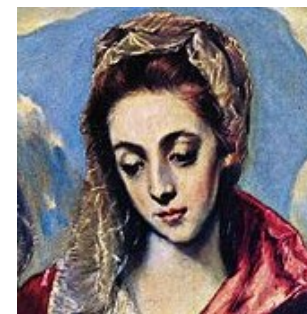
Detalle de la "Sagrada Familia"

En el periodo veneciano las obras cobran más complejidad. Sobre el soporte de técnica bizantina se acentúa un claro manierismo y donde las arquitecturas del paisaje adquieren un sentido especial.