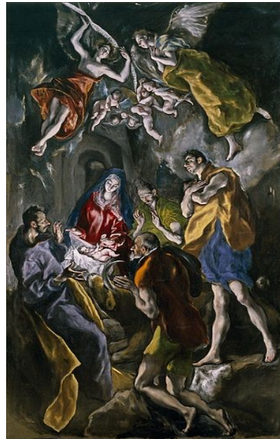
“Adoración de los pastores” de Santo Domingo el Antiguo de Toledo (1610-1614)

A medida que los años van pasando, la pintura de El Greco va perdiendo colorido acentuando un gran dramatismo. El Greco pintó obras de temática profana, entre los que destacan paisajes de Toledo, y el cuadro