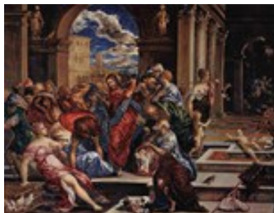
"La expulsión de los mercaderes"

De su primera etapa , de formación en Creta, resalta la tradición bizantina con detalles característicos de la pintura mural y de iconos y un gusto por no representar referencias espaciales. Por ejemplo El tránsito de la Virgen .