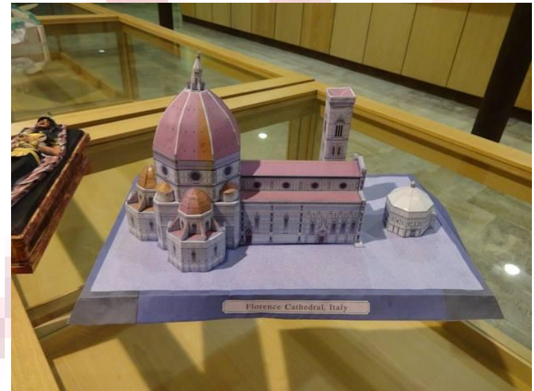
Catedral de Santa María de la Flor, Florencia, Italia.