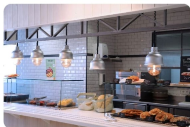
Centro Deportivo (CD) THE CLUB