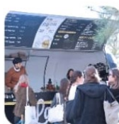
La Rollerie Foodtruck