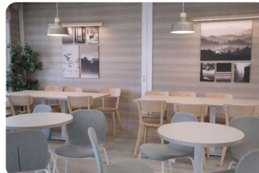
Edificios O-P THE CORNER