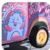
Name the Truck Foodtruck