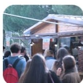
La Cabaña Foodtruck