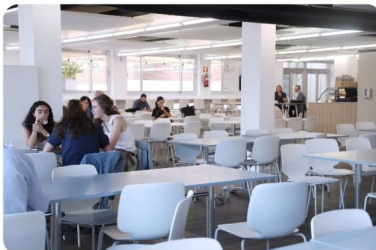
Edificio Central THE MARKET