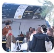
La Rollerie Foodtruck