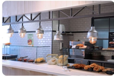
Centro Deportivo (CD) THE CLUB