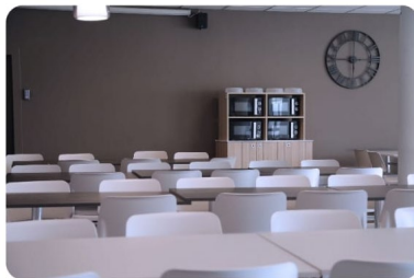
Colegio Mayor THE HOME