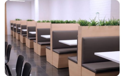
Edificio Biblioteca (B) THE FAST GOOD