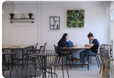
Edificio M THE GARDEN