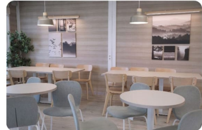
Edificios O-P THE CORNER