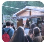
La Cabaña Foodtruck