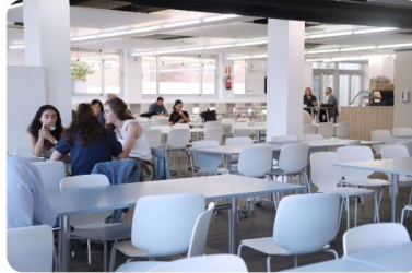
Edificio Central THE MARKET