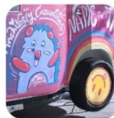
Name the Truck Foodtruck