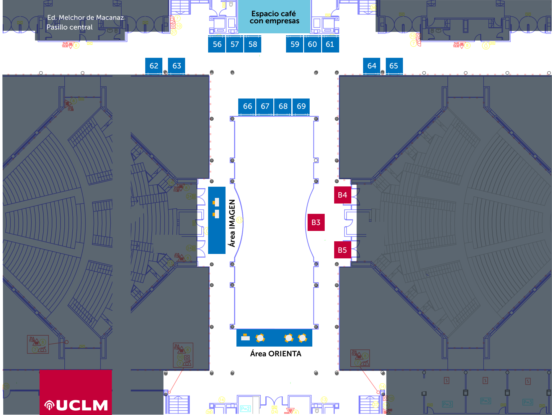
10 Stands + Area IMAGEN + Area ORIENTA