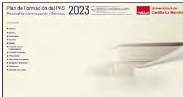
Foto GER.1. Interactivo Plan de Formación PAS 2023