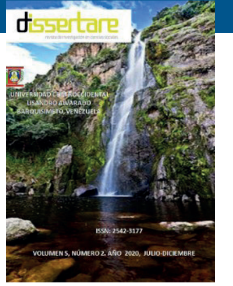
La profesionalización de las revistas científicas y la gestión estratégica ante el desafío digital