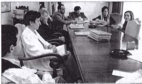
La directora de Enfermería, en el centro, junto a algunos de los ponentes en el curso

La Escuela de Enfermería de Ciudad Real creó ayer un curso sobre