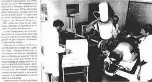
La mayoría de los diplomados que salen de esta escuela se encuentran en el extranjero.

En general, los enfermeros españoles que trabajan en el extranjero encuentran mejores condiciones laborales y salariales que en España. Sin embargo, también enfrentan desafíos como el idioma y la adaptación a nuevas prácticas profesionales.