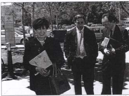
El consejero (izq), acompañado por la directora de la Escuela y el representante de Satsse