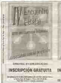
Cartel de este cuarto encuentro