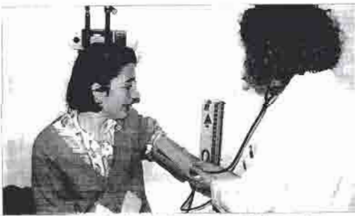
La enfermera en el laboratorio. Foto: J. López. Desde primera fila, el primer curso de enfermería en la Universidad de Ciudad Real.

Enfermería es una profesión que ha crecido mucho en los últimos años. En España, el número de enfermeros ha aumentado considerablemente, pero en el extranjero, especialmente en Europa, el número de enfermeros sigue siendo limitado. Esto ha creado una gran demanda de enfermeros españoles en el extranjero, especialmente en países como Alemania, Francia y Suiza.