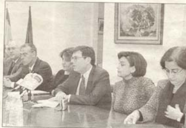
Ayer, durante la rueda de prensa en el Rectorado