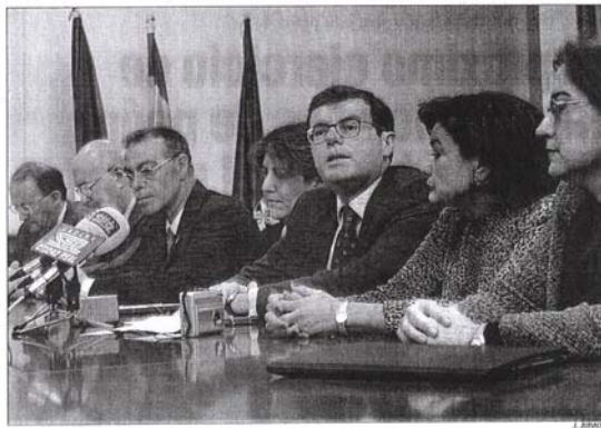
Representantes de los ayuntamientos, Acciones Integradas y la Universidad ayer en la firma

La aparición de los servicios sociales como un yacimiento de empleo también es un dato a tener en cuenta