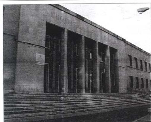
Escuela de Enfermería de Ciudad Real

IV ENCUENTRO ESTATAL DE ESTUDIANTES DE ENFERMERÍA