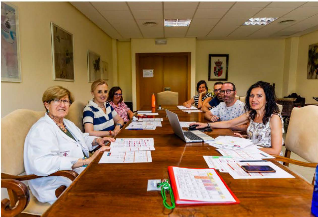
El privilegio de formar a casi 3.700 enfermeros