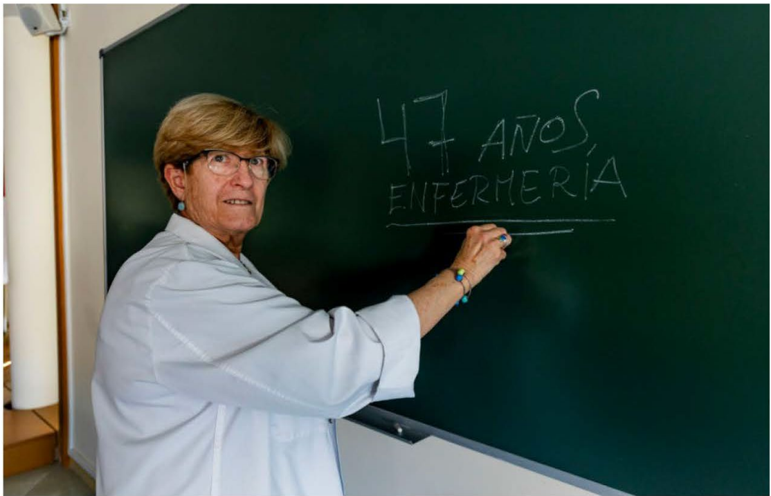
El privilegio de formar a casi 3.700 enfermeros