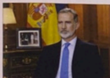
Imagen de portada: Mensaje de Navidad de Don Felipe Palacio de La Zarzuela, Madrid, 24.12.2023.